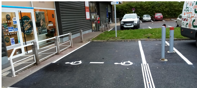
AEGL a le vent en poupe et vient de décrocher une commande de Grand Calais Terres et Mers.