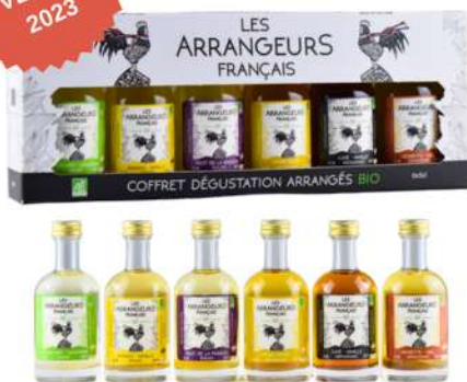
COFFRETS DÉGUSTATION 6 mignonnettes de 5cl

Rhum Ananas Vanille / Citron Vert Gingembre / Passion Armagnac Café Vanille / Noisette Miel / Poire épicée