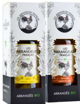
ÉTUIS À BOUTEILLE