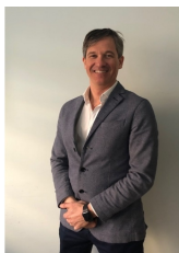
Adriano Vico Formazione e agevolazioni alle Aziende