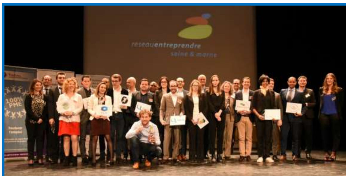
Photo de groupe des Lauréats 2017