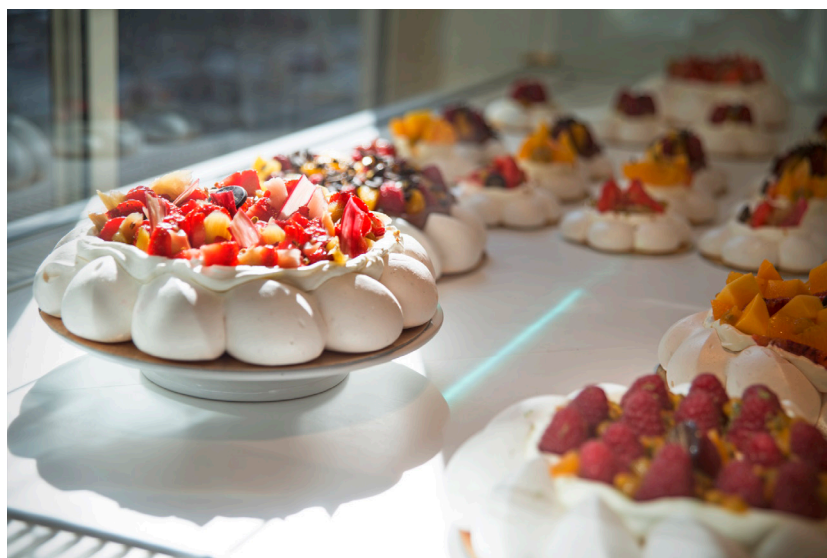
Chaque semaine, 5 créations de pavlova : 2 permanentes et 3 recettes de saison.

Dès lors, tout s'accélère : le projet débute officiellement en janvier 2015, le logo créé en février, mars le projet est présenté aux amis et la première boutique ouvre en octobre.